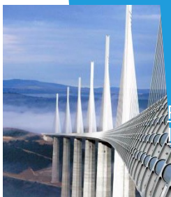
C1/C2 Veľmi nízke/Nízke