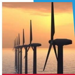
C5/CX Veľmi vysoké/ extrémne